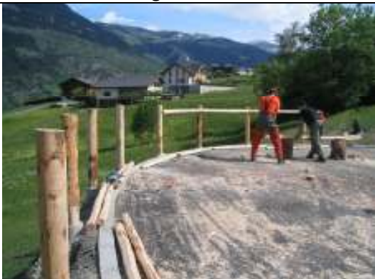
Holzzaun Erschliessungsstrasse Leitwang