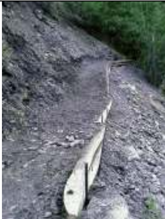
Wanderweg z'Gartu - Tunetsch